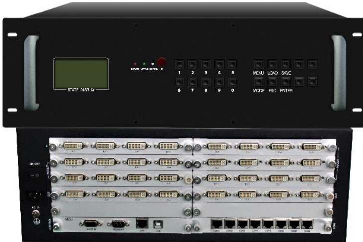
Рис. 2 Профессиональный контроллер видеостен